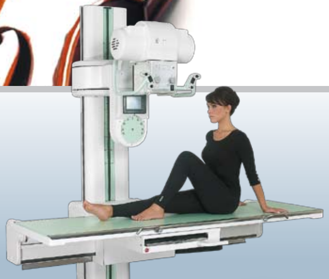
COMPACT RADIOGRAPHIC UNIT